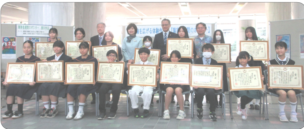
令和7年12月18日(木)に「令和7年度障害者週間の集い」が県庁1階県民ホールにて開催されました。今年も「心の輪を広げる」体験作文、障害者週間ポスターの募集において入賞された皆様に参加し、表彰式が行なわれました。誠にありがとうございます。