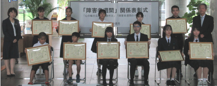
※2面に作品の一覧を載せておりますので、合わせてご覧下さい☆彡

和令4年度障害者週間(水)に、 14年度障害者週間集い 開催。今年も心輪を広げ、 表彰式が行なわれた。ご 加募集におめでとうございます。 誠しにおめでとうございます。