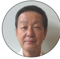
沖縄県手をつなぐ育成会

級こ域け活配 所連 定際年者 は識根日会ナい世の に にとでま動慮そ見合そ期連に権2まの強本「とな界中繰深 学か暮しの義の・権の的合批利0だ中くでとのい中でりく べららた推務中改利審なの准条0まに存はな共現のす返感 なのが進付で善委查審障し約6だお在いつ存状応がし謝 い「権」けは勸員に査害締「年先いしまてでで援「押をすをの 障脱「な」告会よを者約がににて「だいは者サし申るつ公年 害施入どや民がかり受権国探国なは公にる「がッ寄し皆な益頭 児設が保障「間公ら「け利と択際りマ共感よ「既マカせ上様ぐ社に が化障一障企表日昨ね委なさ連そス機染うウにス「てげの育団あ るや「害定害業さ本年ば員つれ合うク関へでイ他ク中くまご成法た 「い・評文のま府月に日2てす離個警「コで着をコ。援運沖、 こ通な者価化合しへにまよ本0「。す人戒し口は用見口 協に県年 と常いがは芸理た総国せつは1障 時の心かナコしるナ 協に県年 を学「地受術的。研際んて国4害 期意がし、社口てと波 力対手中