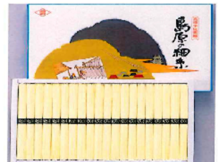
島原の細糸 HS-30 化粧箱 1,000g詰 (50g×20束)