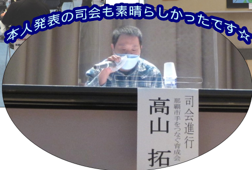
本人発表の司会も素晴らしかったです☆