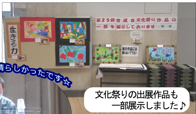
文化祭りの出展作品も一部展示しました♪