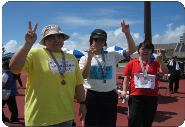
メダルもらえたよ~~!(^^)!