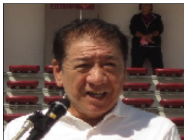
沖縄市： 桑江朝千夫 市長