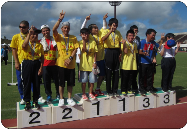
みんなで頑張ってメダルを獲りました!!