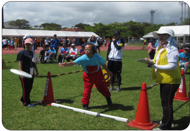
遠くまで飛ばすぞ~~(^^)/