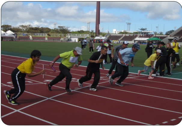
ヨーイスタート! 1番になるぞ~(´-`)/